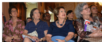
Feministas históricas presentes no evento

o Prefeito Eduardo Paes e a SPM Rio informaram, no Palácio da Cidade, a criação das Casas da Mulher Carioca - espaços destinados ao resgate e fortalecimento da cidadania e da autoestima das mulheres -, o prêmio Nise da Silveira - que contemplou oito mulheres que se destacaram em diferentes áreas de atuação - e uma parceria com a Secretaria Municipal do Trabalho para realização de cursos de capacitação para o mercado de trabalho. No ato, também foi formalizado o CEAM Chiquinha Gonzaga - Centro de Atendimento Especializado que atua